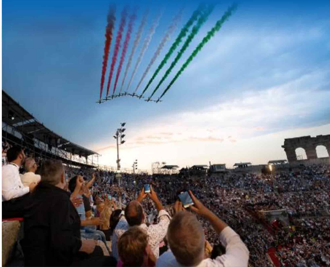
L'Arena e il Tricolore per il centenario dell'Opera festival: dal 2013 lirica patrimonio Unesco