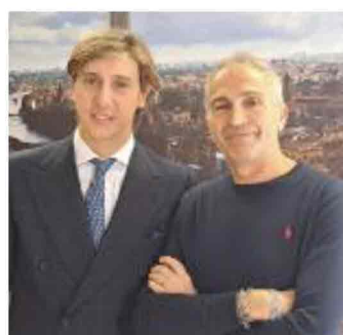
Bongiorno e Magrini

Residenze per studenti, per famiglie e lavoratori (oltre mille posti), un'area commerciale e un centro sportivo con campi da calcio, da padel e tennis: 40 mila metri quadri oggi nel degrado, oggetto di un maxi piano di rigenerazione da 70 milioni di euro che, entro il 2030, restituirà l'ex magazzino ferroviario del Porto San Pancrazio